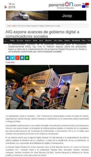
Nota de prensa en el portal PanamaOn