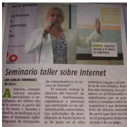
Visitas a los medios para promocionar el programa.

El programa se desarrolló en alianza con la Facultad de Ciencias Sociales de la Universidad Católica Santa María La Antigua (USMA), institución que lo acreditó académicamente. Ambas organizaciones compartieron las responsabilidades relacionadas con la convocatoria, la difusión y la selección de los participantes.