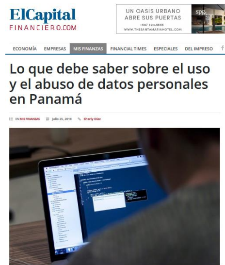
Publicación en el medio digital Capital Financiero

Todos los participantes produjeron materiales de comunicación a partir de la información brindada por los facilitadores. En la jornada de evaluación participaron 8/10 (ver formato). Todos manifestaron estar dispuestos a seguir enrolados en los programas de formación de ISOC Panamá y los temas escogidos como más atractivos para futuras capacitaciones fueron: Privacidad y protección de datos, desórdenes informativos ( fake news ), seguridad digital para periodistas y derechos humanos en la era digital.