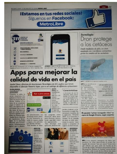
Publicación en el periódico Metro Libre